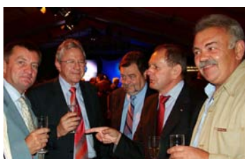
Elus de la C.C.P.P.