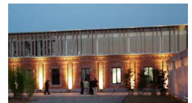
La nuit tombe ... c'est beau !