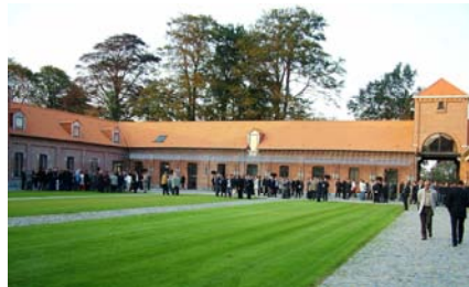
Les invités vont visiter ce bijou