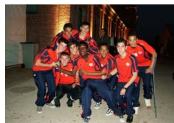
Les jeunes (en formation)